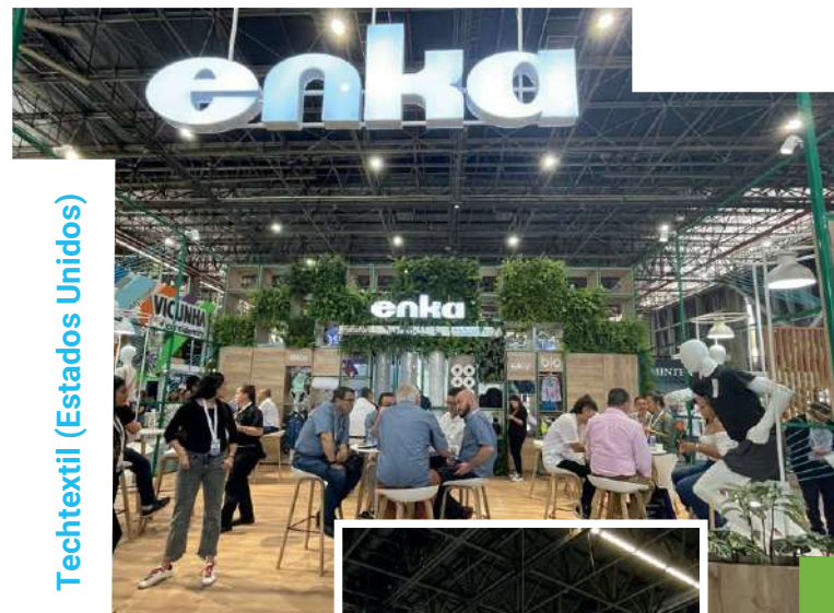
Techtextil (Estados Unidos)